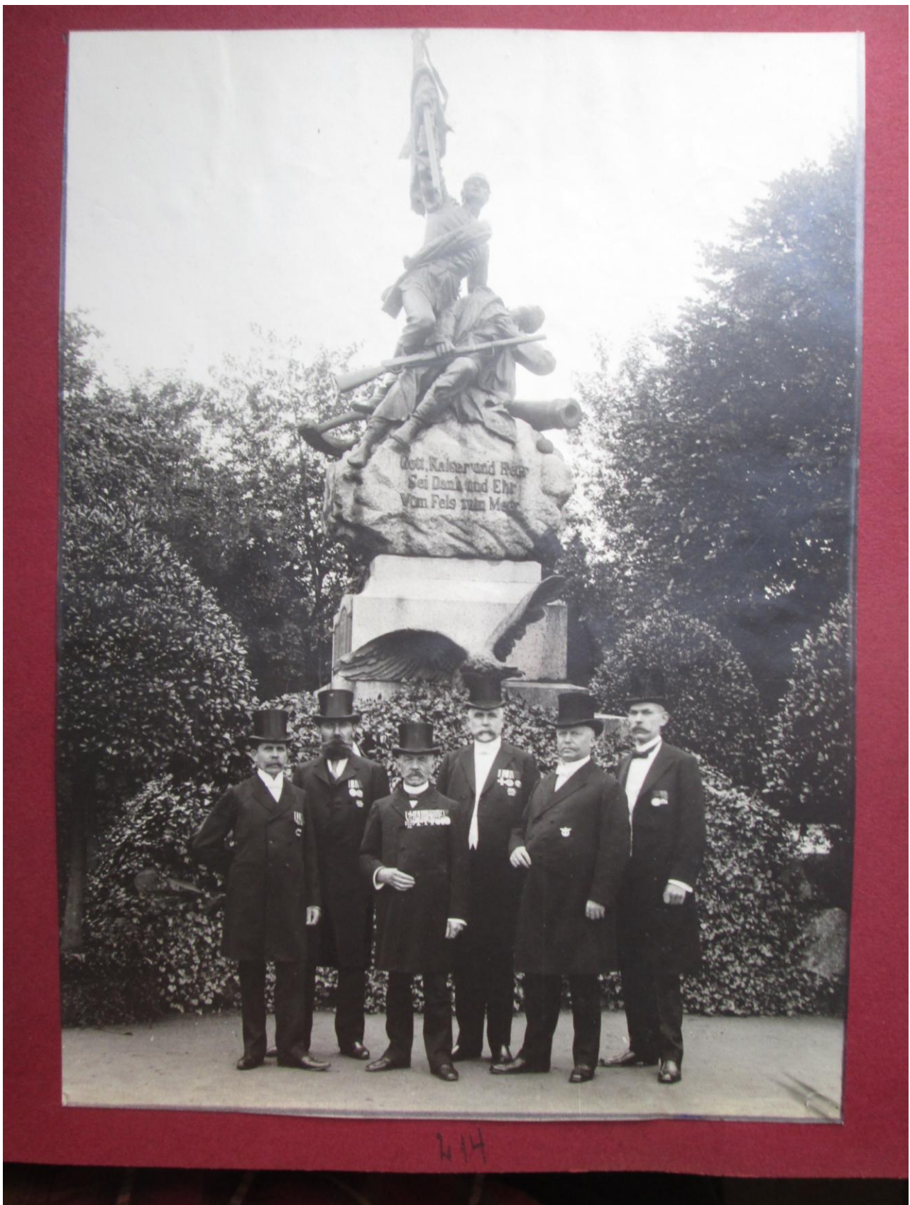
„Gott, Kaiser und Heer / Sei Dank und Ehr / Vom Fels zum Meer“ (Inscription auf dem Denkmal)