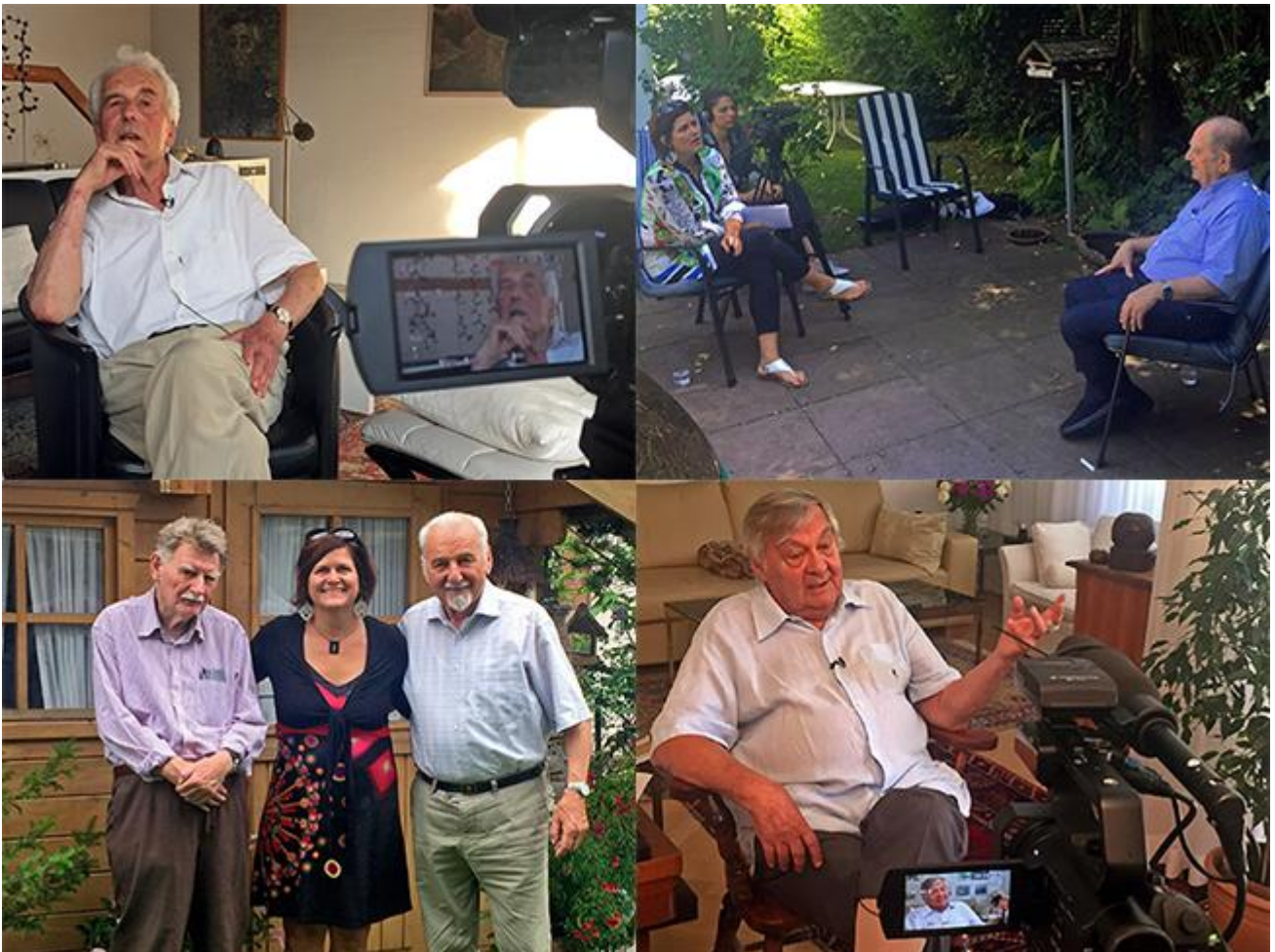
Werkfotos von den Interviewaufnahmen mit den 56er Augenzeugen in Deutschland im Sommer 2016

Die Dokumentarfilmregisseurin Réka Pigniczky drehte im Sommer 2016 auf Einladung des CHB Videointerviews mit ungarischen Emigranten, die am Ungarn-Aufstand teilgenommen oder diesen persönlich erlebt haben, und danach nach Deutschland geflüchtet sind. Die einzelnen Lebenswege der Augenzeugen-Interviews werden im CHB in einer Videoinstallation gezeigt, in der sich die persönlichen Schicksale zu einem historischen Bild bis zur Gegenwart zusammenfügen: über den Alltag im Ungarn der 50er Jahre, die Geschichte des Freiheitskampfes 1956 und die Flucht vor der Vergeltung danach, die Emigration von etwa 200.000 Ungarn, die ihr Land damals verlassen haben und über den Neuanfang in ihrer neuen Heimat, vor allem in den USA und in der BRD.